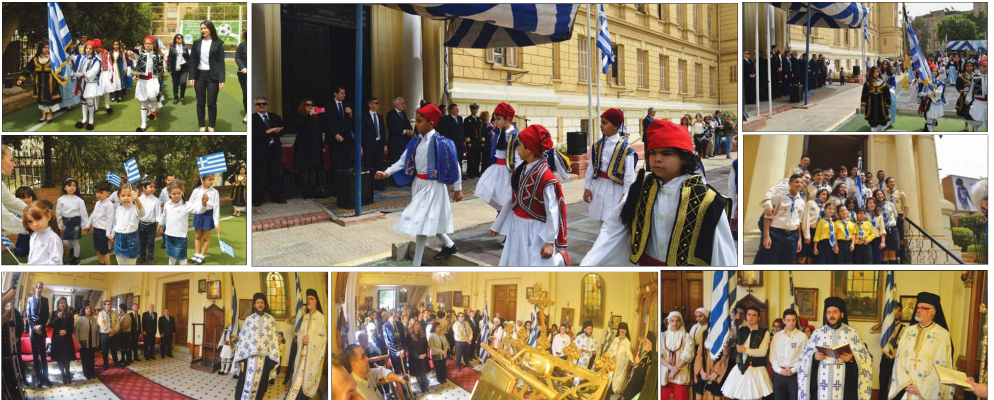
(συνέχεια από την 1 η σελίδα)

Αφού ψάλλθηκε από όλους τους παρευρισκόμενους το «Υπερμάχου», στο τέλος της Δοξολογίας, ο Έλληνας Πρέσβης κ. Μιχαήλης Διάμεσης διάβασε μήνυμα του Προέδρου της