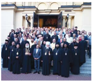
(συνέχεια από την 1 η σελίδα)

Πολωνία, Ουκρανία και Ζιμπάμπουε, τρία σημαντικά ταξίδια του Πατριάρχη Αλεξανδρείας Θεοδώρου