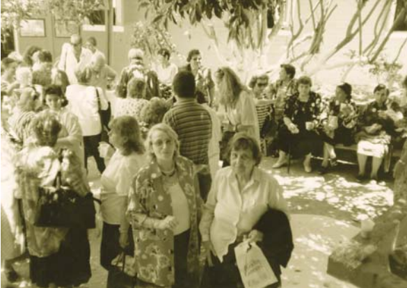
(συνέχεια από την 1 η σελίδα)