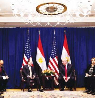
(συνέχεια από την 1 η σελίδα)

Twitter οι δύο άνδρες δεσμεύθηκαν στον αγώνα κατά της τρομοκρατίας. Ειδικότερα, ο Πομπέο χαρακτήρισε παραγωγική την συνάντηση για του Ντόναλντ Τραμπ με τον πρόεδρο της Αιγύπτου Αμπντελ Φάταχ αλ Σίσι , επισημαίνοντας ότι συζητήθηκε η κοινή δέσμευση των δύο χωρών για την καταπολέμηση της τρομοκρατίας αλλά οι τρόποι επίκειμενης των ήδη ισχυρών δεσμών μεταξύ των Ηνωμένων Πολιτειών και της Αιγύπτου.