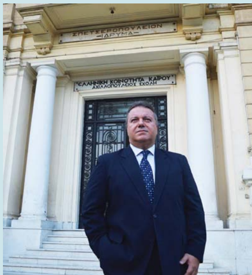
(συνέχεια από την 1 η σελίδα)

χωρών σε όλους τους τομείς. Από αυτή τη συνεργασία αντλούμε όλοι μας δύναμη για να συνεχίσουμε την ιστορική πορεία της Ελληνικής Κοινότητας Καΐρου στη γη που γεννηθήκαμε και που συνεχίζουμε να ζούμε. ΧΡΟΝΙΑ ΠΟΛΛΑ!».