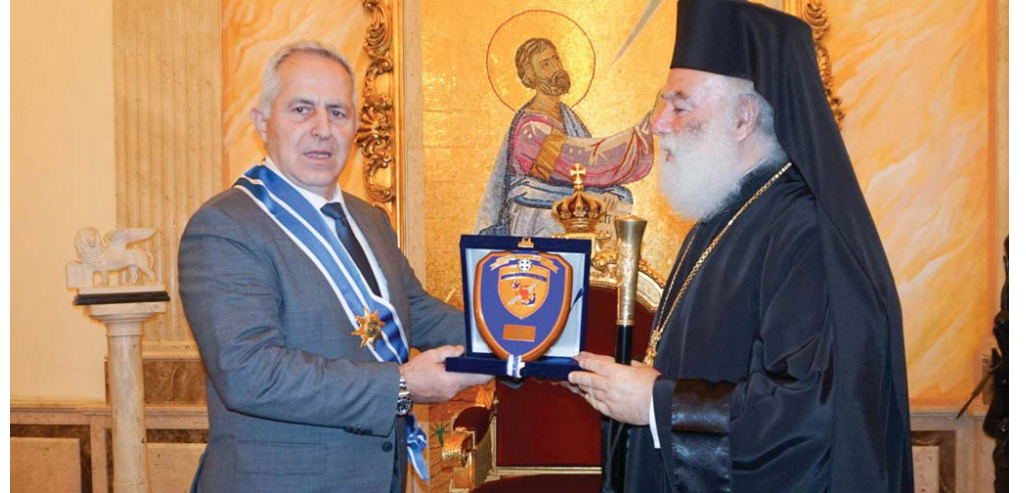
(συνέχεια από την 1 η σελίδα)

Η παραβατική συμπεριφορά των Τουρκικών Ενόπλων Δυνάμεων στο Αιγαίο και στην Αν. Μεσόγειο, αν τι με τ ω π ί ζ ε τ α ι με αποφασιστικότητα και ψυχραιμία από τις Ελληνικές Ένοπλες Δυνάμεις. Ειδική μνεία έγινε στην διαδικασία ενεργοποίησης Μέτρων Οικοδόμησης Εμπιστοσύνης Ελλάδας-Τουρκίας, για την πρόληψη της έντασης. Στο πλαίσιο της επίσκεψης, ο υπουργός Εθνικής Άμυνας απηύθυνε πρόσκληση στον Αιγύπτιο ομόλογο του να επισκεφτεί την Ελλάδα για διμερή επίσκεψη αλλά και προκειμένου να συμμετάσχει στην 3η Τριμερή Σύνοδο Υπουργών Άμυνας μεταξύ Ελλάδος, Αιγύπτου και Κύπρου. Στο πλαίσιο της επίσκεψής του στην Αίγυπτο, ο υπουργός Εθνικής Άμυνας κατέθεσε στεφάνι στο Μνημείο του Άγνωστου Στρατιώτη και στον τάφο του Προέδρου Anwar Sadat . Στις δηλώσεις του ο κ. Αποστολάκης ευχαρίστησε τον ομόλογο του, τον Υπουργό Άμυνας, Στρατηγό Ζάκι, για την εξαιρετική φιλοξενία, όπως είπε χαρακτηριστικά, και την πρόσκληση που του απηύθυνε να επισκεφτεί την Αίγυπτο. «Όπως ξέρετε, η συνεργασία με την Αίγυπτο ξεκινάει από πολύ παλιά. Ιδιαίτερα τα τελευταία χρόνια έχει γίνει εξαιρετικά αποτελεσματική. Στο κομμάτι που αφορά στις Ένοπλες Δυνάμεις, έχουμε