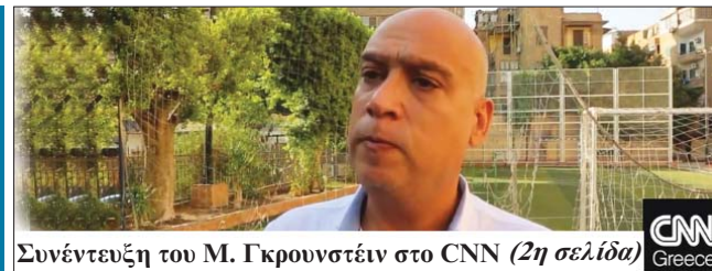
Συνέντευξη του Μ. Γκρουνστίν στο CNN (2η σελίδα) CNN Greece