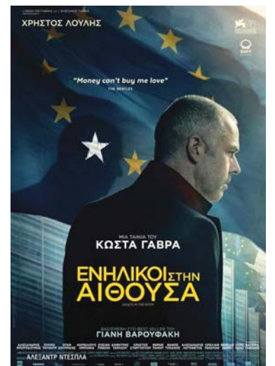
(συνέχεια από την 1 η σελίδα)

Η νέα πολυσυζητημένη ταινία ελληνογαλλικής παραγωγής του Κώστα Γαβρά , βασισμένη στο βιβλίο του πρώην υπουργού Οικονομικών Γιάνη Βαρουφάκη εξιστορεί όσα διαδραματίστηκαν με επίκεντρο την Ελλάδα το πρώτο εξάμηνο του 2015, «Ενήλικες στο δωμάτιο» θα προβληθεί στο πλαίσιο του «12ου Πανοράματος Ευρωπαϊκού Κινηματογράφου» στο Κάιρο, την Τρίτη 12 Νοεμβρίου 2019, στις 19.00 στον κινηματογράφο Zawya και την Πέμπτη 14 Νοεμβρίου 2019, στις 16.00 στον κινηματογράφο Zamalek .