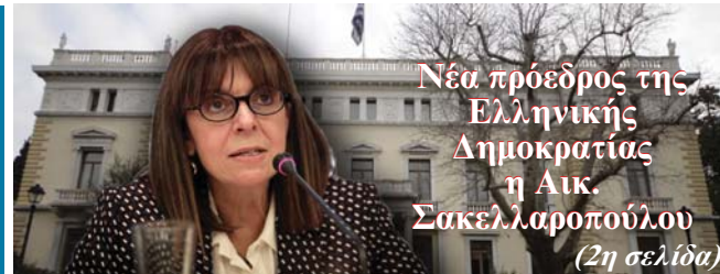
Νέα πρόεδρος της Ελληνικής Δημοκρατίας η Αικ. Σακελλαροπούλου (2η σελίδα)