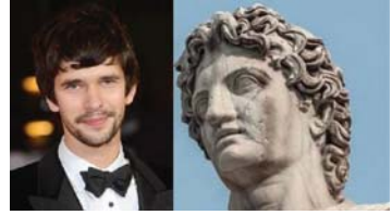
αυτό ο σκηνοθέτης Jack Holland έχει προγραμματίσει να επισκεφτεί το Κάιρο.

Το Netflix προετοιμάζει σειρά με θέμα τον στρατηγικό Μέγα Αλέξανδρο. Ανάμεσα στις χώρες που θα πραγματοποιηθούν τα γυρίσματα είναι η Αίγυπτος και το Μαρόκο. Πρόκειται για βρετανική παραγωγή και η όαση Siwa στην Αίγυπτο θα αποτελέσει το σημείο έναρξης των γυρισμάτων. Αυτά αναμένεται να ξεκινήσουν μέσα στον Φεβρουάριο και για το σκοπό