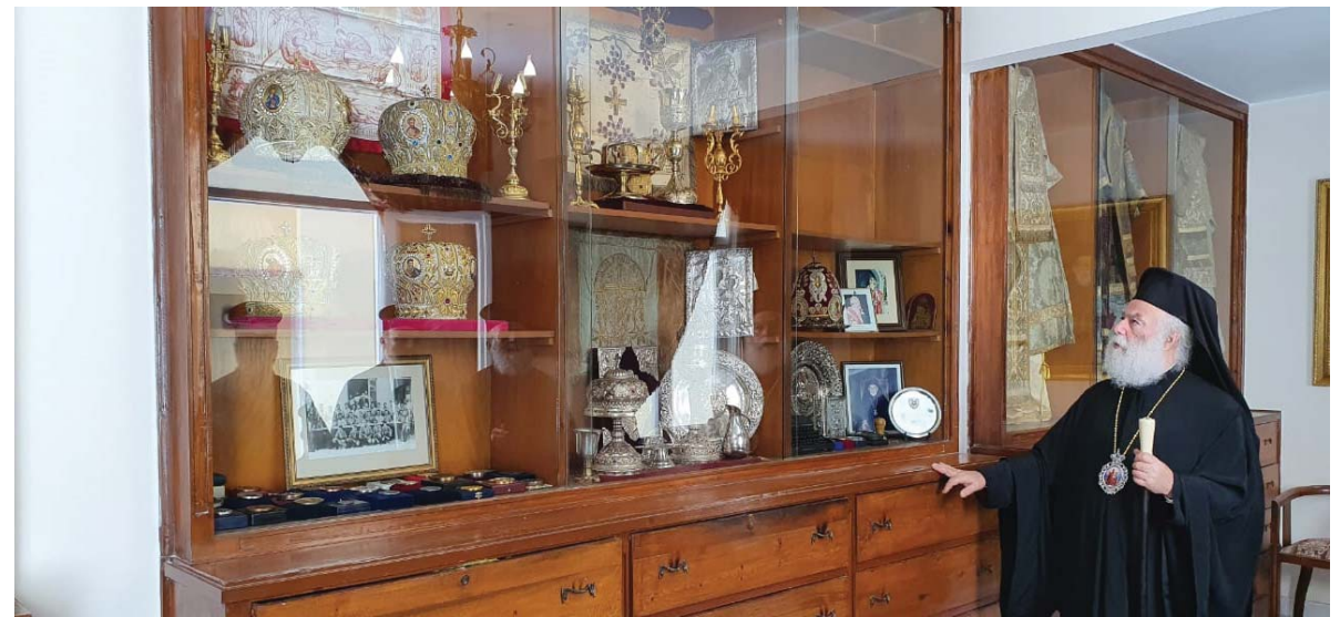
πατ. Παύλο και κατ' επέκταση τον Πατριαρχικό Επίτροπο Αλεξανδρείας, τον Ναυκράτιδος Νάρκισσο, για τις προσπάθειες που κατέβαλαν μαζί με τα παιδιά μας, ώστε να επανιδρυθεί το Εκκλησιαστικό Πατριαρχικό μας μουσείο και να δείχνει σε όλους του προσκνηντές που θα περάσουν τη

δείχνοντας την ιστορική συνέχεια και το μέλλον του Πατριαρχείου Αλεξανδρείας στην δοκιμαζόμενη Αφρική. Ο Προκαθήμενος του Δευτερόθρονου Πατριαρχείου, έντονα συγκινημένος, είπε ότι σήμερα που τιμάται ο Άγιος Ιωάννης ο Σιναΐτης, εορτάζει όλη η Αίγυπτος. «Θα ήθελα να εκφράσω τη χαρά μου σήμερα που εορτάζουμε τον Άγιο Ιωάννη, το συγγραφέα της Κλίμακος από το Όρος Σινά», είπε και πρόσθεσε: «Μεγάλη χαρά πήραμε στο Μοναστήρι μας, το Πατριαρχικό, το ευλογημένο του Σάββα του Ηγιασμένου. Με τους αρχιερείς εγκαινιάσαμε το επανιδρυθέν μουσείο με τα άμφια και τα τιμαλφή των Πατριαρχών και Αρχιερέων που πέρασαν και τίμησαν το Θρόνο του Αποστόλου και Ευαγγελιστού Μάρκου. Ο Θεός να τους μακαρίσει. Εκ βαθέων θα ήθελα να ευχαριστήσω τον Θεοφιλέστατο Άγιο Ταμιάρικα Γερμανό, το γέροντα σκευοφύλακα