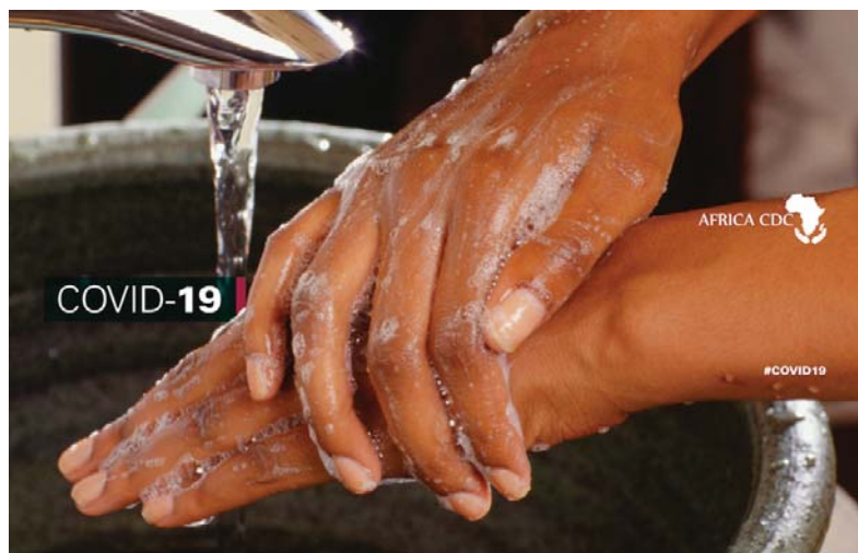
Μέχρι το πρωί του Σαββάτου 9 Μαΐου 2020 στην Ελλάδα είχαν σημειωθεί 2.691 κρούσματα και 150 νεκροί και στην Αίγυπτο 8.476 κρούσματα και 503 νεκροί.

«Το σύστημα υγείας στην Αφρική είναι πολύ αδύναμο. Κλειδί είναι η ενημέρωση για το πώς θα