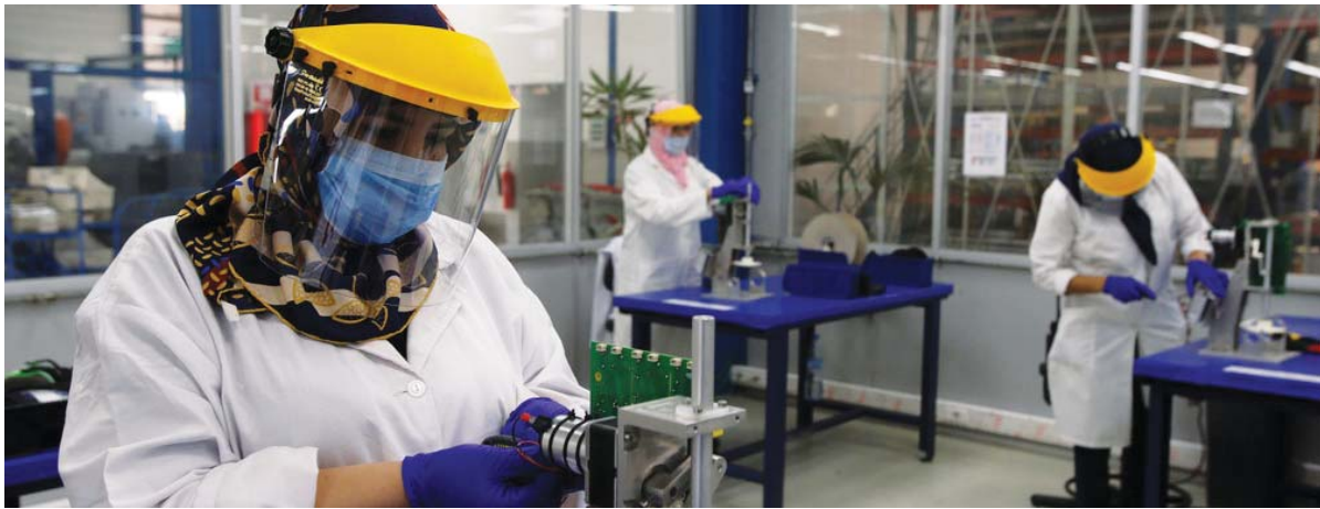
(συνέχεια από την 1 η σελίδα)

συμβεί, επειδή απλά οι νόμοι της οικονομίας δεν μπορούν εύκολα να ανιοηθούν.