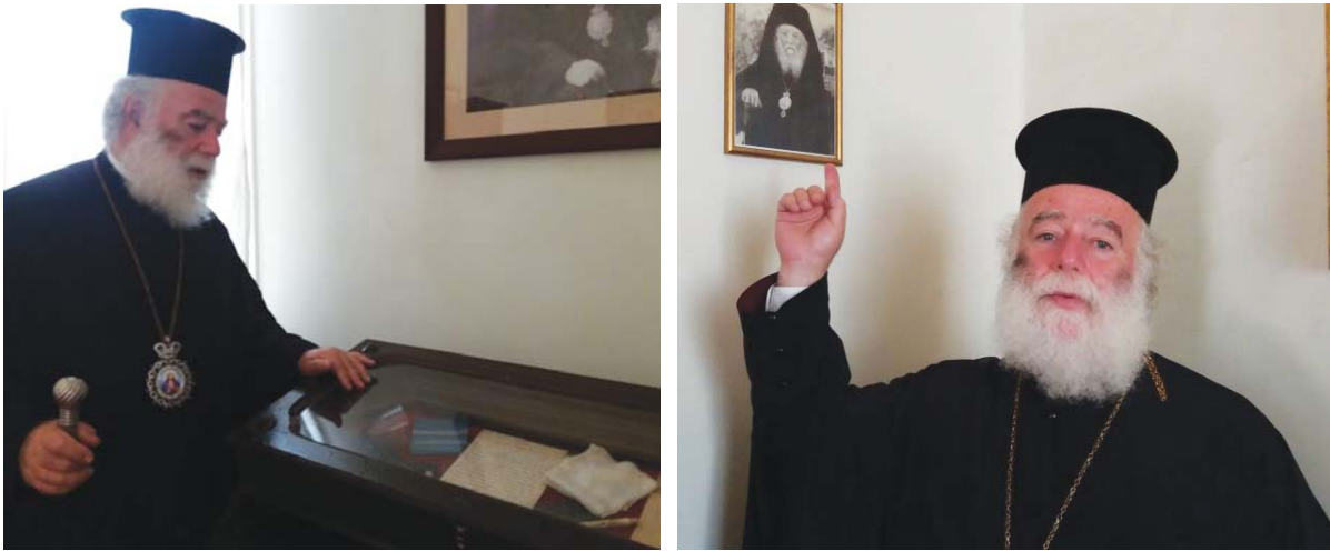
Ο Πατριάρχης Αλεξανδρείας Θεόδωρος Ξεναγίτς στο κελί του Αγ. Νεκταρίου που βρίσκεται στην Πατριαρχική Επιτροπή Καΐρου. Αποκαλύπτει δε ότι μικρό παιδί, στη γενέτειρά του, το Αρκαλοχώρι Κρήτης, έγραψε κηρύγματα τα οποία υπέγραψε ως « μικρός ιεροκήρυκας Νεκταρίου». (5.11.18 / φύλλο 685)

Η 20η Απριλίου 1961 είναι η ημερομηνία που η Ιερά Σύνοδος του Οικουμενικού Πατριαρχείου επισήμως ανέγραψε στο Ορθόδοξο Αγιολόγιο το όνομα του εν Αγίοις Πατρός ημών Νεκταρίου Μητροπολίτου Πενταπόλεως. Μετά την οσιακή κοίμησή Του την 9η /11/1920 ο