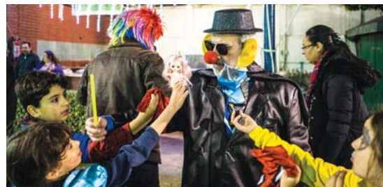
(συνέχεια από την 1 η σελίδα)

τους χρόνο και τον δικό τους χώρο για να στεγάσουν και επί της ουσίας να ξεδιπλώσουν τις μοναδικές τους δημιουργίες. Ο λόγος φυσικά είναι για τους Απόδημους Πρόσκοπους του Καΐρου που 110 χρόνια τώρα δίνουν αδιάλειπτα το παρόν στην μεγάλη πρωτεύουσα της Νειλοχώρας. Το Σάββατο 18 Φεβρουαρίου διοργάνωσαν μια ακόμα μοναδική εκδήλωση που όπως έγραψαν στην πρόσκλησή τους, με την αυτάρεσκη βεβαιότητα που τους χαρακτηρίζει, θα ήταν ένα γλέντι από τους «ειδικούς» Όπερ και εγένετο. Όλα ξεκίνησαν στις πέντε και μισή με την υποστολή της σημαίας και τις μυστηριακές κραυγές τους που φώναζαν χωρισμένοι στους τρεις Προσκοπικούς τους κύκλους που δημιούργησαν. Και αφού ολοκλήρωσαν την απόλυτη και επιβεβλημένη τους ιεροτελεστία το παιχνίδι και η γιορτή ξεκίνησε. Οι βαθμοφόροι πήραν τις θέσεις τους πίσω από τα γνωστά παιχνίδια και μικροί και