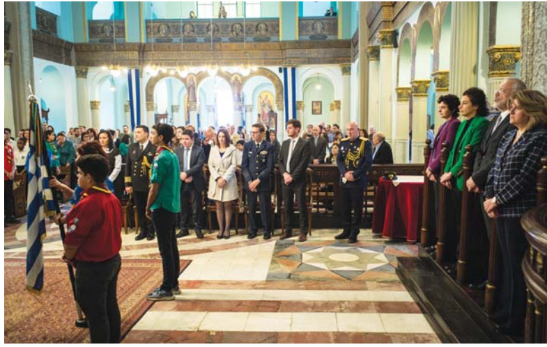
(συνέχεια από την 1 η σελίδα)