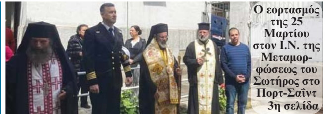
Ο εορτασμός της 25ης Μαρτίου στον Ι.Ν. της Μεταμορφώσεως του Σωτήρος στο Πορτ-Σαϊντ 3η σελίδα

ΕΤΟΣ 24 ο ΑΡ. ΦΥΛΛΟΥ 811 Δευτέρα 3 Απριλίου 2023