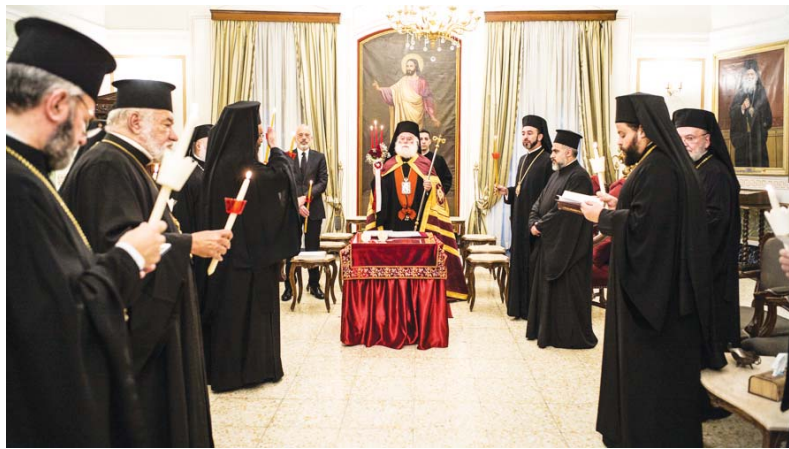
(συνέχεια από την 1 η σελίδα)

Ακολουθία της Θ' ώρας του Πάσχα, η όπως είναι γνωστή «της 9ης ώρας». Αποτελεί την μοναστηριακή παράδοση του Ορθόδοξου τυπικού και προηγείται του Έσπερινού. Αναφέρεται στο θάνατο του Χριστού, ο οποίος, σύμφωνα με τη σχετική διήγηση των Ευαγγελίων, έγινε την ενάτη ώρα της ημέρας. Το μυσταγωγικό πεδίο της εσπέρας, ενεργοποιήθηκε αρχικά στο Αρχοντάκι της Μονής από τον ίδιο τον Μακαριώτατο Πατριάρχη μέσα από το μοίρασμα της Αναστάσιμης φλόγας, αλλά και μέσα από το χαρμόσυνο άγγελμα της είδησης ότι ο Χριστός αναστήθηκε, το οποίο στεντορεία τη φωνή μετέφερε για ακόμα μια φορά στο χριστεπώνυμο πλήθος.