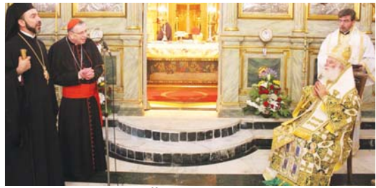
(συνέχεια από την 1 η σελίδα)