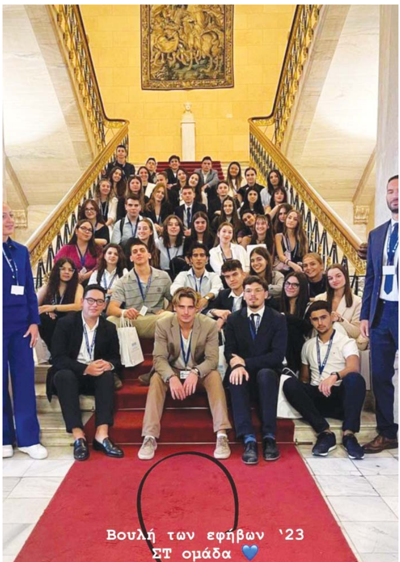
Βουλή των εφήβων '23 ΣΤ ομάδα

της Αμπέτειο με πολύ όρεξη, για να διερευνήσουμε σε βάθος τις γενεσιουργίες αιτίες της βίας σε όλες τις εκφάνσεις της ζωής μας. Είδαμε ταινίες μαζί με τα παιδιά, κάναμε αναρίθμητες συζητήσεις,