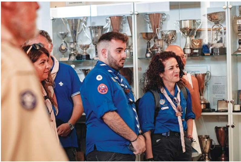
(συνέχεια από την 1 η σελίδα)

και βάλε χρόνια από την στιγμή της ίδρυσής τους, ισοδυναμεί με μια έκρηξη χαράς, κεφιού (δεν έχουμε δει ή φωτογραφίσει ποτέ κάποιον κατσούφη Πρόσκοπο), αλλά και υψηλών αξιών ζωής που οι Πρόσκοποι είναι εθισμένοι στην πραγμάτωσή τους, μέσα από την συλλογική τους δράση. Μια τέτοια μεγάλη Προσκοπική συνάντηση πραγματοποιήθηκε στις 16 και στις 17 Σεπτεμβρίου στον Μαραθώνα Αττικής στην Ελλάδα. Ο λόγος για την 74 η συνάντηση των Πτυχιούχων Διακριτικού Δάσους στην οποία για φέτος, πέντε Αιγυπτιώτες ενήλικοι Πρόσκοποι έγιναν δεκτοί σε αυτή την μεγάλη Προσκοπική οικογένεια. Μέρος των κεντρικών εκδηλώσεων της Προσκοπικής συνάντησης ήταν και η τελετή απονομής του Διακριτικού Δάσους στις νέες και τους νέους Πτυχιούχους. Μια νέα φουρνιά νέων, αφοσιωμένων στις ιδέες και τα ιδανικά του Προσκοπισμού έλαβε, μέσα από το ιδιαίτερο τελετουργικό το πολύτιμο αυτό διακριτικό. Ανάμεσά τους και οι δικοί μας Πρόσκοποι. Τα Ενήλικα