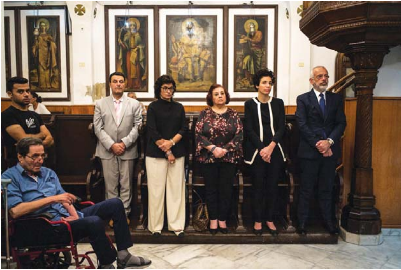
(συνέχεια από την 1 η σελίδα)

τις ιατρικές τους υπηρεσίες στους συνανθρώπους τους που βρίσκονταν σε ανάγκη, ακολουθώντας απαρέγκλιτα την εντολή που έδωσε ο Χριστός προς τους μαθητές του λέγοντάς τους « Δωρεάν Ελάβετε, Δωρεάν Δότε ». Η ζωή τους αποτέλεσε ένα φωτεινό παράδειγμα ηθικής βιονομίας που ακτινοβολεί ανέφελα έως τις μέρες μας. Ο Μακαριώτατος Πατριάρχης στον λόγο του ανέφερε με συγκίνηση: «Θα ήθελα να σας ευχαριστήσω που ήρθατε απόψε σε ένα φτωχικό, αλλά ένδοξο προάστιο. Βρίσκεστε απόψε παιδιά μου στην Σούμπρα. Εδώ που χτυπούσε η καρδιά της Ελλάδας, Χιλιάδες οι Έλληνες, και η Εκκλησία μας δεν ξέχασε όλα αυτά τα παιδιά. Όπως μας λέει ο Πρόεδρος μας ο κύριος Ζουμπούλιδης δεκάδες παιδιά βρήκανε εδώ, περιθαλψη, φαγητό και βιβλία. Αλλά πάνω από όλα το Πατριαρχικό Κέντρο τους έδινε υποτροφίες». Ο ηγούμενος του Αλεξανδρινού Θρόνου αναφέρθηκε και στο δράμα