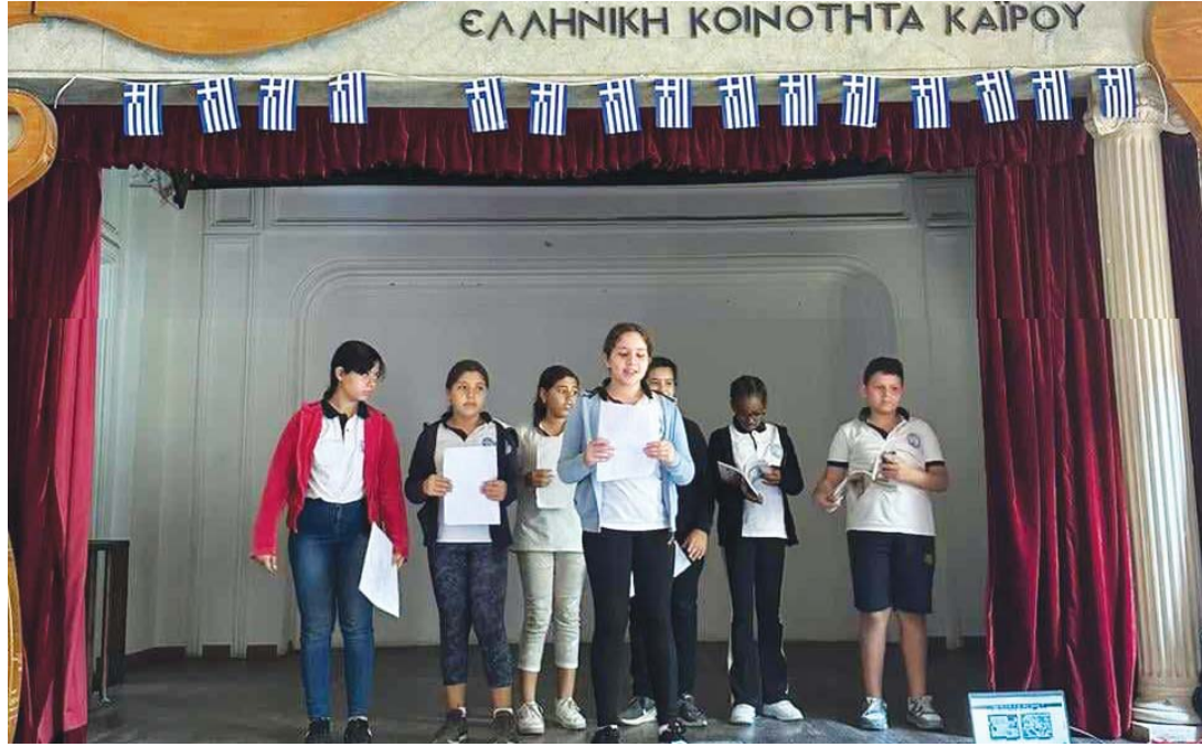
(συνέχεια από την 1 η σελίδα)

χούντας που τους σημάδευε με μανία. Δεν δειλίσαν όμως. Έμειναν στις θέσεις τους και με τον ηρωισμό τους έσωσαν το γόητρο μιας ολόκληρης χώρας που για επτά χρόνια παρέπαιε μέσα στον φόβο. «Εδώ Πολυτεχνείο, Εδώ Πολυτεχνείο». Η σπαραξικάρδια φωνή του Δημήτρη Παπαρήστου από τον Ραδιοφωνικό σταθμό των ελευθέρων και αγωνιζόμενων φοιτητών, αντήχησε για ακόμα μια χρονιά στο θέατρο της Αχιλλοπούλειο Σχολής. Τα παιδιά έμαθαν μέσα από την