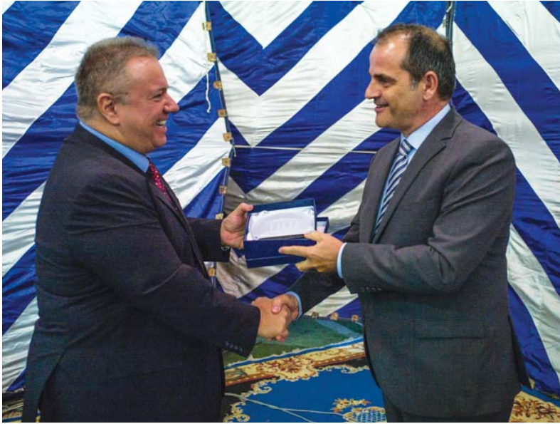
(συνέχεια από την 1 η σελίδα)