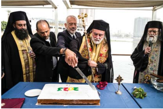
(συνέχεια από την 1 η σελίδα)

Ναυτικός Όμιλος στο επίκεντρο της Ελληνικής, αλλά και της Αιγυπτιακής κοινωνικής ζωής ως σημεία ενός λαμπερού κοσμοπολιτισμού που ξέφευγε κατά πολύ από τον αριθμό των μελών τους. Ο Ε.Ν.Ο.Κ στις όχθες του μαγικού Νείλου και ο Ν.Ο.Ε. στην αγκαλιά του Σαρωνικού κόλπου να ατενίζει την Μεσόγειο, την θάλασσα που ενώνει την κοινή μας μνήμη αλλά και την ιστορική μας περπατησιά στον χώρο και στον χρόνο.