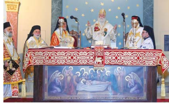
(συνέχεια από την 1 η σελίδα)

Άγιο, για να προσκυνήσουμε την ιερά εικόνα Του και να του καταθέσουμε τα προσωπικά μας αιτήματα. Εδώ σ' αυτόν τον πύργο, του Βαβυλωνίου τείχους ο Άγιος μας φυλακίστηκε και βασανίστηκε δείχνοντας υπομονή και δοξάζοντας τον Αυτρωτή μας. Εν συνεχεία μεταφέρθηκε και το μαρτύριο του ολοκληρώθηκε στην Λύδδα της Παλαιστίνης όπου και ο τάφος Του, που είναι πηγή ιαμάτων. Στην περιοχή εκείνη σήμερα επικρατούν πολεμικές ακαταστασίες, πόνος, αδικία, δυστυχία ... Παιδιά μου ας ενδύσουμε τις προσεγγές μας μαζί με τις γοερές κραυγές των χιλιάδων αμάχων και μικρών παιδιών της Γάζας και των άλλων τριγύρω περιοχών, να επικρατήσει η ειρήνη του Αναστάντος Χριστού μας.