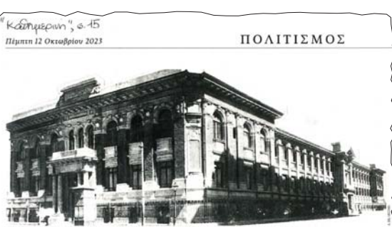
Το κτίριο του Αμερικανικού Πανεπιστημίου στο Μεγάλο Κάιρο (στο Κάιρο πριν το 1950 της Σκωτίας, του 1950).