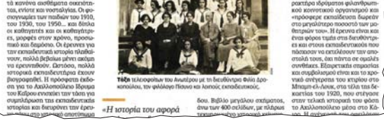
Η ιστορία του σχολείου

Το ιστορικό και εκπαιδευτικό αποτύπωμα του Αχιλλοπούλειου Ιδρύματος στο Κάιρο