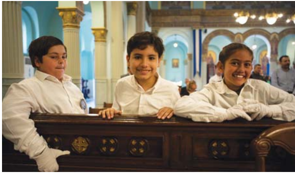
απολαμβάνοντας την συντροφιά και την χαρούμενη συναναστροφή με αγαπημένους ανθρώπους. Στον εορτασμό της 25 ης Μαρτίου