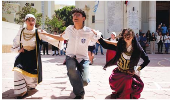
υπερηφάνεια, αποσπώντας το ζωηρό χειροκρότημα όλων. Μετά την τιμητική παρέλαση, σειρά είχαν οι παραδοσιακοί χοροί από