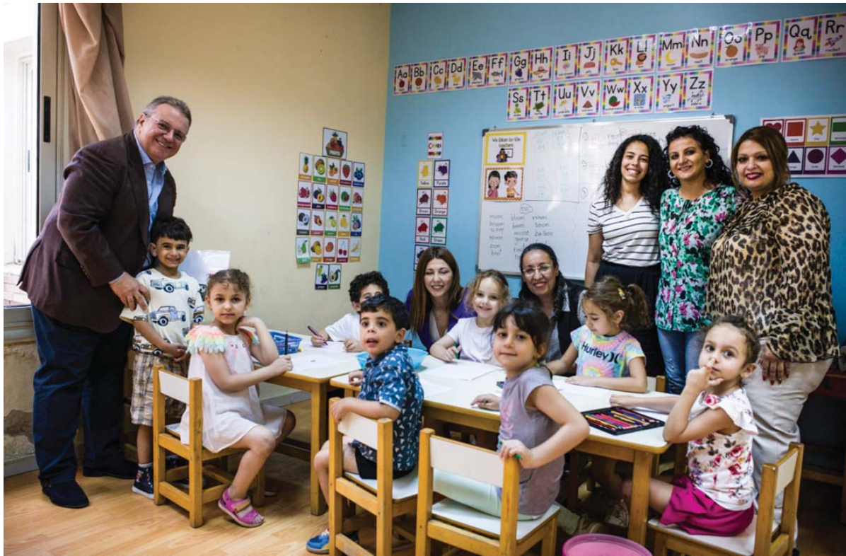
Η κα Ζαχαράκη πλησίασε αμέσως τα παιδιά, συνομίλησε μαζί τους, αντάλλαξε αστεία και δημιούργησε ένα κλίμα απρόσμενα οικείο.

Μπροστά από το Θέατρο της Αχιλλοπούλειου, ανάμεσα στις μαρμαρινές προτομές των μεγάλων ευεργετών της Ελληνικής Κοινότητας, οι μαθητές του Δημοτικού, μαζί με τη Διευθύντριά τους κα Γεωργία Πετούση, περίμεναν την Υπουργό κρατώντας μια πολύχρωμη ανοιξιάτικη ανθοδέσμη, ένα αναμνηστικό δώρο και χαμόγελα γεμάτα ανυπομονησία.