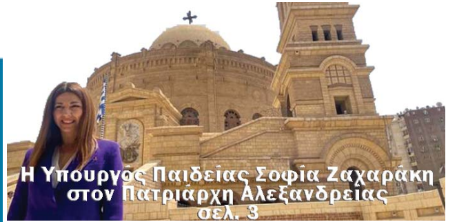
Η Υπουργός Παιδείας Σοφία Ζαχαράκη στον Πατριάρχη Αλεξανδρείας σελ. 3